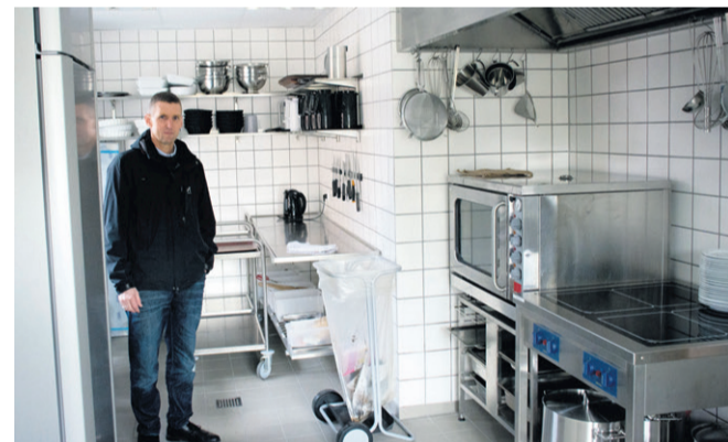
Et nyt industrikøkken er indrettet. Og nu er gaskomfuret erstattet af et elkøkken, så der ikke er fare for nye eksplosioner.