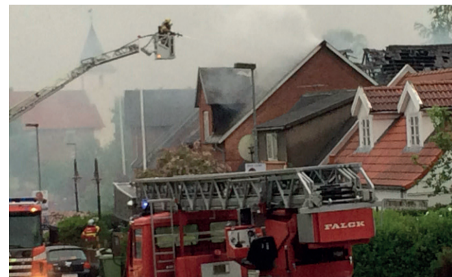
Branden i Borum Forsamlingshus brød ud 13. juni sidste år, mens der var en privatfest i huset. Ingen kom til skade.